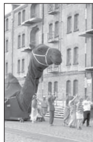
Speicher XI, Abt. 4

Die Rückzugsräume der GA-PSY (Gesellschaft für Ambulante psychiatrische Dienste) bieten ersten Schutz in Krisen, und die Bremer Werkgemeinschaft begleitet Menschen psychosozial.