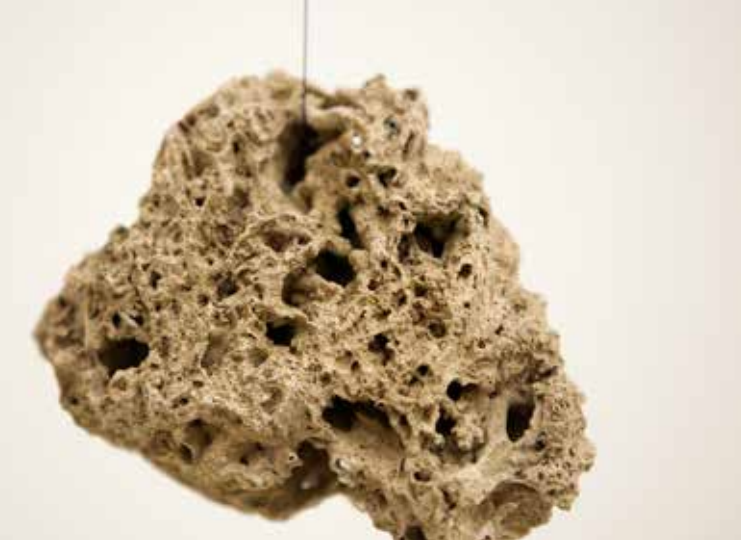
Ausstellung MADNESS: Christian Fogarolli, Phantom Stone, 2018